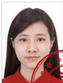
印章或其他 物品遮挡人像