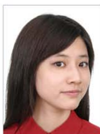
头部侧向一边未正视镜