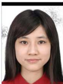
相片损坏 或有污渍