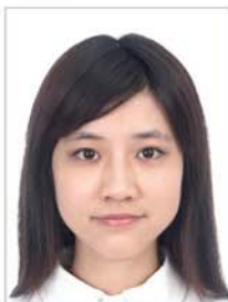
服饰颜色 与背景接近