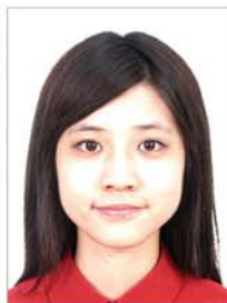
对比度太强 (面部高光)