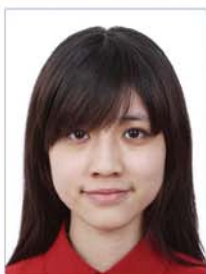
头发遮蔽 眉毛、眼睛或耳朵