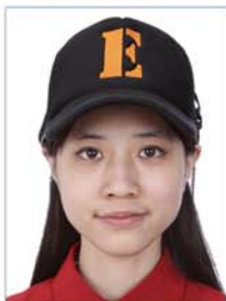
戴帽及发饰 遮挡面部或双耳